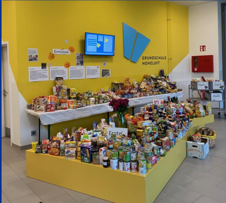
Erntedank: Wir teilen