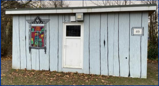
Haus 49 Streitschlichter Projekt