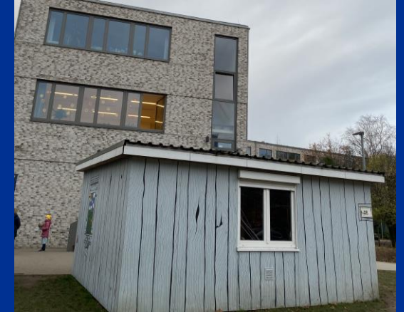
Haus 48 Fahrradwerkstatt