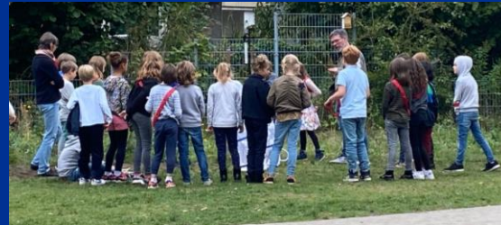
Die Raupe wird zum Schmetterling und wird in der Wildblumenwiese abgesetzt