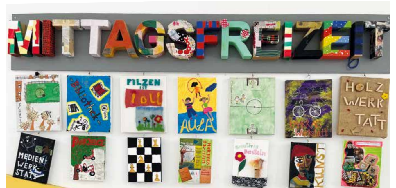
Übersicht der Angebote in der Mittagsfreizeit

In der 90-minütigen Mittagszeit können die Kinder unter anderem in der Holzwerkstatt werkeln, in der Textil- und Filzwerkstatt nähen, häkeln oder stricken, in der Fahrradwerkstatt mit Metall arbeiten oder in der Papierwerkstatt kreativ werden. Zusätzlich finden in den Werkstätten zwei Mal wöchentlich Kurse statt, in denen die Kinder angeleitet werden, Fahrräder zu reparieren, Papier herzustellen oder ein Puppenhaus aus Holz zu bauen. Der Unterschied zwischen der offenen Mittagszeit und den nachmittäglichen Kursen: In der Mittagszeit agieren die Kinder frei und ohne Anleitung. Sie entscheiden selbst, ob und wann sie in eine Werkstatt kommen und welcher Tätigkeit sie dort nachgehen. Während in der Kurszeit meistens eine Aufgabe im Zentrum steht („Nimm bitte einen Hammer und schlage die Nägel in das Brett.“), können sie in der Mittagszeit selbst entscheiden, was sie machen („Ich nehme einen Hammer und schlage Nägel in ein Brett.“).